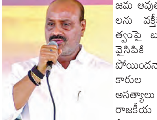
వారికి ప్రజలే తగిన బుద్ధి చెబుతారని హెచ్చరించారు. గత ఐదేళ్ళలో వారికి కేవలం ఓటు బ్యాంకుగా మాత్రమే చూసిన వారు ఇప్పుడు మత్స్యకారుల సంక్షేమంపై మాట్లాడడం హాస్యాస్పదంగా ఉందన్నారు.

కావలి (నెల్లూరు), మే 19 ప్రభాతవార్త: మత్స్యకారుల జీవితాల్లో వెలుగుతున్న ప్రభుత్వంపై విషప్రచారం చేయడం సిగ్గుచేటును కుక్కతోక వంకర వైసిపి నేతల బుద్ధి బిందరబందర అని వ్యవసాయ శాఖ మంత్రి అచ్చెన్నాయుడు తీవ్ర స్థాయిలో మండి వచ్చారు. ప్రజలకు మంచి జరుగుతుంటే జీర్ణింపుకేక అబద్ధాలు, విషప్రచారంలో రాష్ట్రంలో గందరగోళం సృష్టించేందుకు వైసిపి నేతలు ప్రయత్నిస్తున్నారని విమర్శించారు. తుమ్మలపాలంలో మత్స్యకార భరోసా కార్యక్రమంలో మంత్రి మహిళాధికారులు, మత్స్యకార శాఖలో కోట్లాది రూపాయలు సరఫరా చేసిన నేరుగా