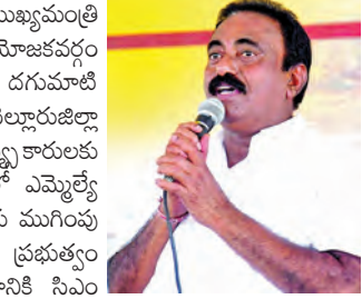
రివైసర్, దగ్గర ఏయిర్పోర్ట్, ఇండ్సోల్ సోలార్ ప్రాజెక్టు, ఇభోక్ కిసాన్ సెజ్ వంటి భారీ ప్రాజెక్టులు కావలి జరిపిన ప్రాంతాల రూపురేఖలను పుర్తిగా మార్చుతున్నాయని తెలిపారు. టీటీసీఎల్ రివైసర్ రావడం వల్ల కావలి ప్రాంతం జాతీయ స్థాయి పారిశ్రామిక మ్యూజిం ప్రత్యేక స్థానం సంపాదించుకుంటుందన్నారు. కావలి నియోజకవర్గంలోని 24 మత్స్యకారుల గ్రామాల మత్స్యకారులు తమ గ్రామం నుంచి నేరుగా సముద్రంలోకి వెళ్ళేందుకు రాకపోకలకు ఇబ్బందులు లేకుండా మట్టిరోడ్ల నిర్మించాలని, ఇందుకు రూ.6.19కోట్లు అవసరమవుతాయని మంజూరు చేయాలని సిఎం చంద్రబాబు అనుమతించారు. తీర ప్రాంతంలో రూ.6.20కోట్లతో బకింగ్పోంట్ కెనాల్ పూడికి తీసి మత్స్యకారులు, రైతులు, స్థానిక ప్రజలకు ఎంతో మేలు జరుగుతుందన్నారు. అలాగే కొండేటి డ్రైయింగ్ రివెన్యూలో చేసి సమగ్ర అభివృద్ధి చేయాలని సిఎం చంద్రబాబు దృఢీకృతి తీసుకొన్నారు. విజ్ఞాపనపై సిఎం సానుకూలంగా స్పందించి నిధులు మంజూరు చేశారు.